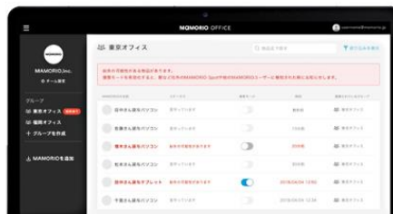
MAMORIO BIZ (管理ツール) x 1