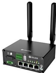
MAMORIO Spot x 1台