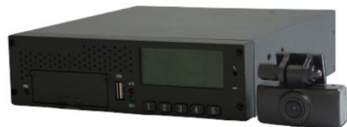
ドラレコ連動型クラウドデジタコ C500

また、導入後も、専属スタッフ付きで安心したサポートを受けられるため、デジタルタコグラフを初めて導入していただく企業様にも安心してご利用いただけます。