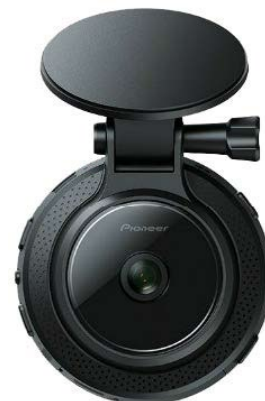
GPS 機能搭載通信型 ドライブレコーダー

衝撃検知や急減速・急発進、速度超過や急ハンドルなど危険挙動を加速度センサ、ジャイロセンサ、車速パルスにより正確に検知できます。また、安全に関する予防措置や事故の検知も可能です。