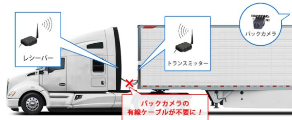
トラック向けバックアイカメラ

トレーラーの切り離し作業を行う場合、有線カメラの渡りケーブルを破損してしまうことがあります。カメラを無線にすることで、ケーブルの切断やカプラの破損がなくなり、今まで破損の際に要していた修理作業が不要になります。