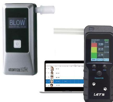
アルコールチェッカー

PALTEKでは、Bluetoothを使用してスマホアプリと連動しアルコールを検知する製品や、出退勤時の計測に便利な据え置き方の製品などを取りそろえています。