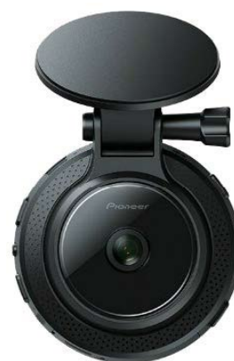
GPS 機能搭載通信型 ドライブレコーダー

通信型ドライブレコーダーはパイオニア株式会社製、通信には安心の株式会社NTTドコモ製SIMカード、動態管理プラットフォームをドコマップ社が開発した「DoCoMAP」をベースに開発しています。衝撃検知や急減速・急発進のほか速度超過や急ハンドルなど危険挙動の検知をGセンサー・ジャイロセンサーと車速パルスにより正確に検知し、安全に関する予防と事故の検知も可能なGPS機能を搭載した通信型のドライブレコーダーです。