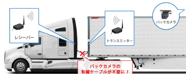
トラック・バス・建設機器向けバックアイカメラ

トレーラーの切り離し作業を行う場合、有線カメラの渡りケーブルを破損してしまうことがあります。カメラを無線にすることで、ケーブルの切断やカプラの破損がなくなり、今まで破損の際に要していた、修理作業が不要になります。