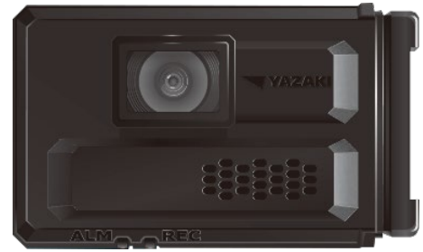
フォークリフト向けドライブレコーダー

さらに、乗務員や車両の稼働状況やバッテリー電圧を見える化し、作業の安全状況を管理できることに加え、見えない稼働を見える化することでフォークリフトの安全運行の確保に貢献します。