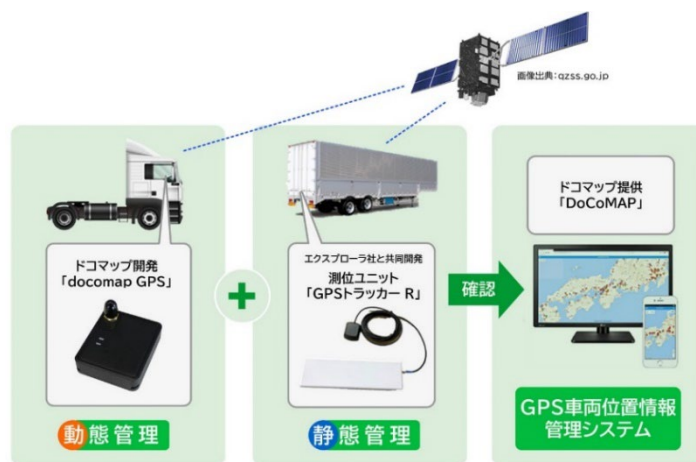
シャーシ位置管理システム「GPS トラッカー-R」

https://www.paltek.co.jp/solution/fleetsmng/list/backeye_camera/index.html