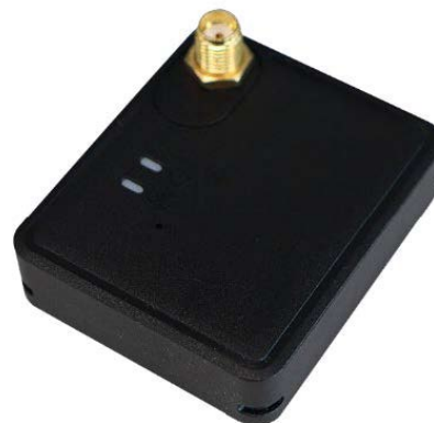
GPS 車両位置管理システム 「docomap GPS」

端末本体は業界最小クラスの大きさで気軽に導入ができることを利点としています。GPS の受信する衛星の種類が準天頂衛星システム「みちびき」を含む5つであるため、位置情報の精度も高くなっています。