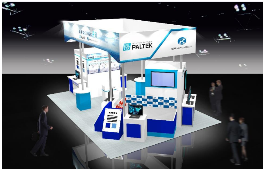
展示会ブースイメージ

お客様の製品開発支援、技術サポートなど多くの経験をしているレスターグループの2社が、これらの市場に求められるエッジAIの実現に向けた最適な製品やソリューションをお届けします。是非ブースにお立ち寄りください。