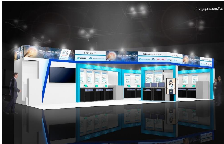
出展ブースイメージ

PALTEK は FPGA やその他の半導体などを活用した製品開発支援、技術サポート、受託開発などで培ってきたノウハウを活用し、農機建機・製造業・SmartCity 市場に向けた展示を予定しています。また、「～共創による現実社会との共生～」をテーマに、共同出展する企業とともに共創ブースを用意しています。