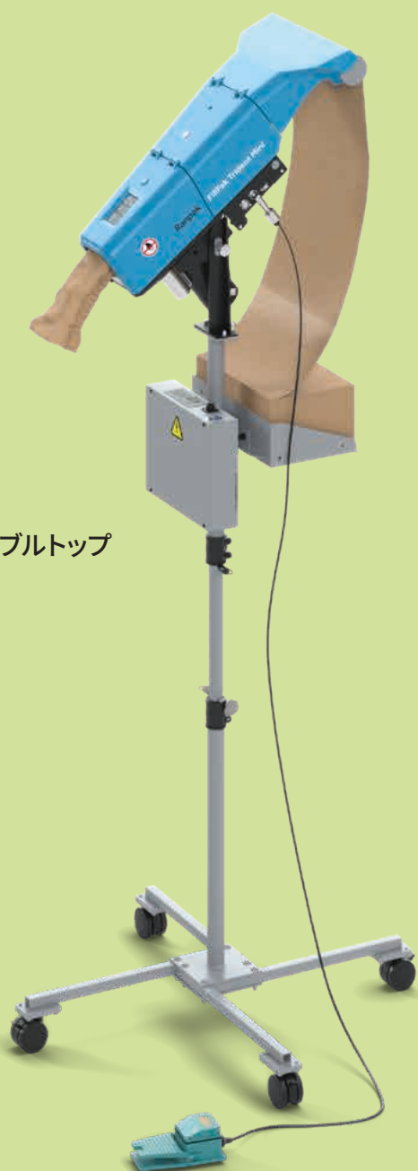
FillPak Trident Mini™